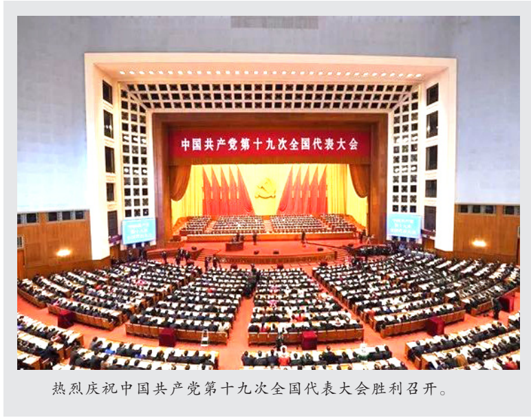
热烈庆祝中国共产党第十九次全国代表大会胜利召开。

荆州市内部资料准印证第 36 号 2017 年 10 月 19 日 星期四 总第 164 期 地址：荆州市南湖路 9 号 电话：0716-4309982 E-mail:jsjtqdb@163.com