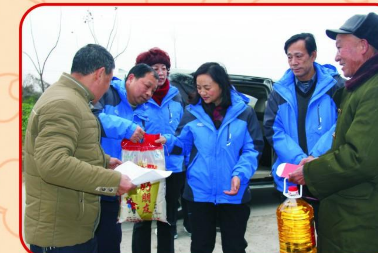
集团公司领导慰问困难群众