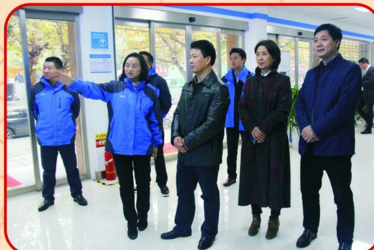
荆州市人民政府副市长向斌调研指导