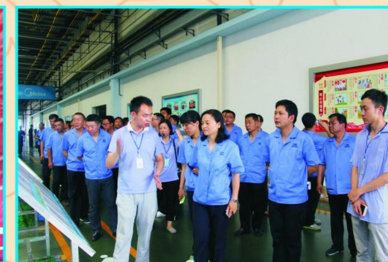
集团公司组织中层以上干部到大型企业参观学习