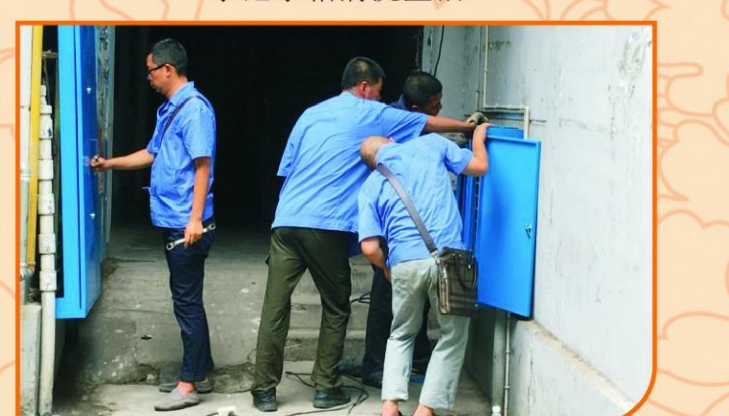
城区老旧小区表井表箱更换