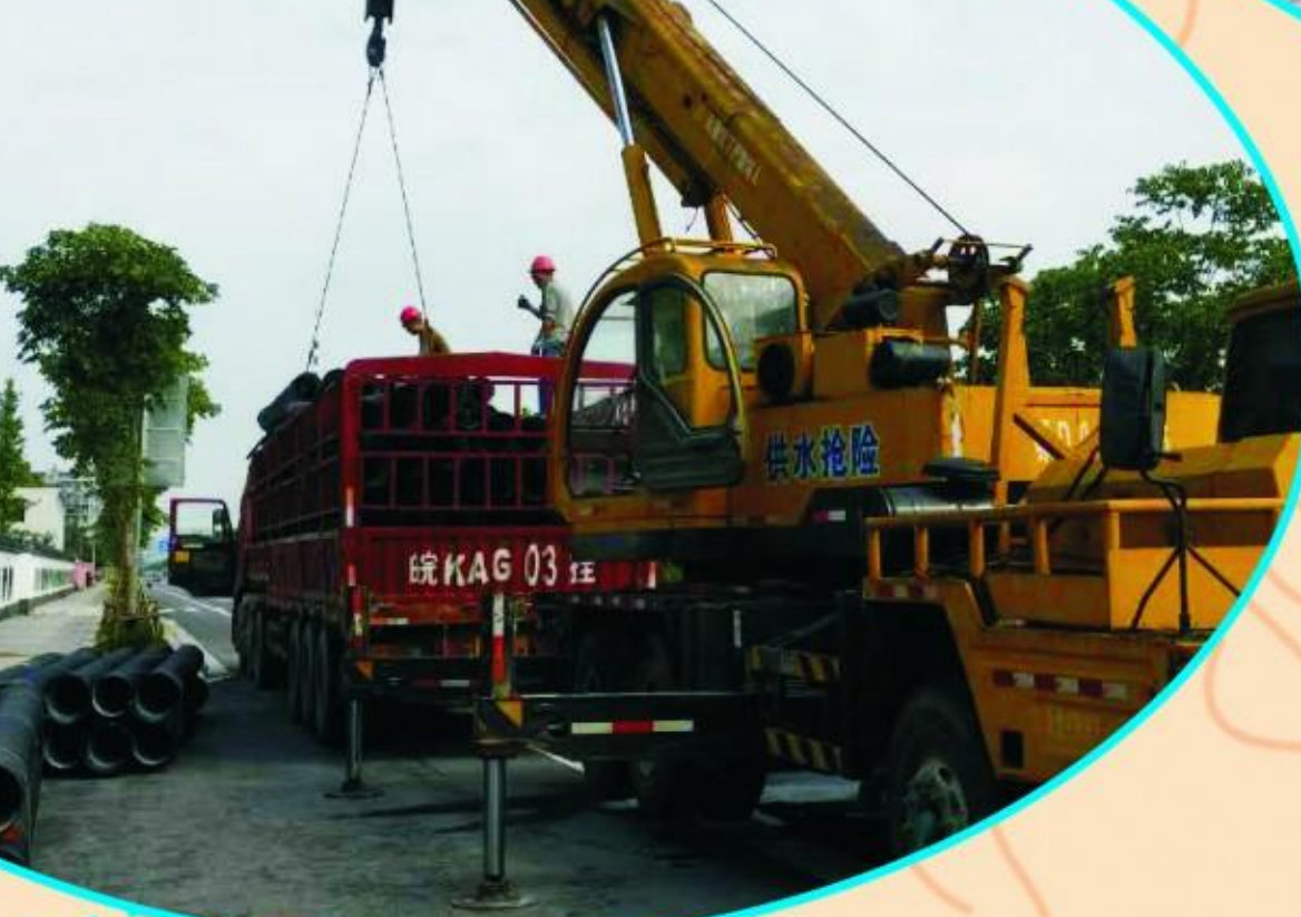
供水管网施工现场