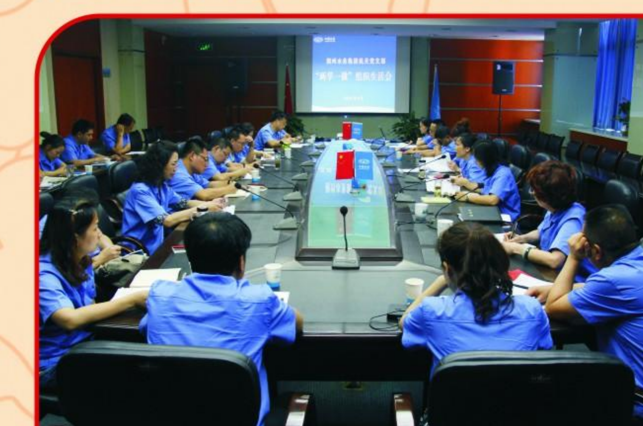
“两学一做”组织生活会

2016年以来，集团公司党委严格落实“两学一做”学习教育要求，一是全面开展学习教育宣传动员及专题讲座。二是增强党员学习意识，购买《中国共产党章程》、《习近平总书记系列重要讲话读本》、《中国共产党问责条例》等学习材料，发给全体党员，使学习常态化。三是开展民主生活会、组织生活会，党员干部结合实际工作情况做自我剖析，进一步接受思想洗礼。四是开展“上善若水映党徽”党小组活动，十六支党小组分别开展各具特色的党日活动，如走进瞿川养老院慰问老年人、服务创卫志愿服务活动、对宝塔湾江边400米“救命一米线”进行加固等。通过这一系列活动，进一步提高了党员干部的党性修养和群众意识。