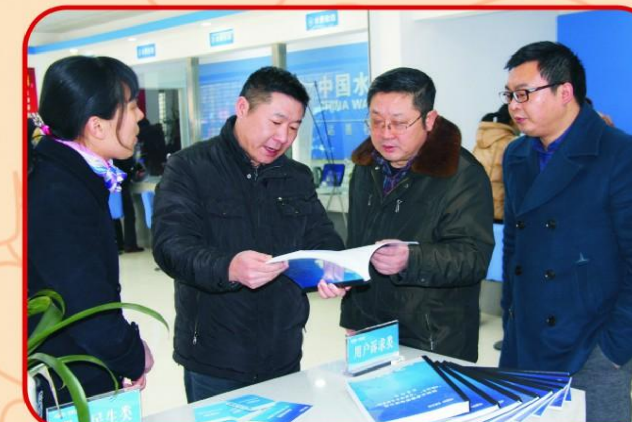
荆州市文明办领导检查指导工作