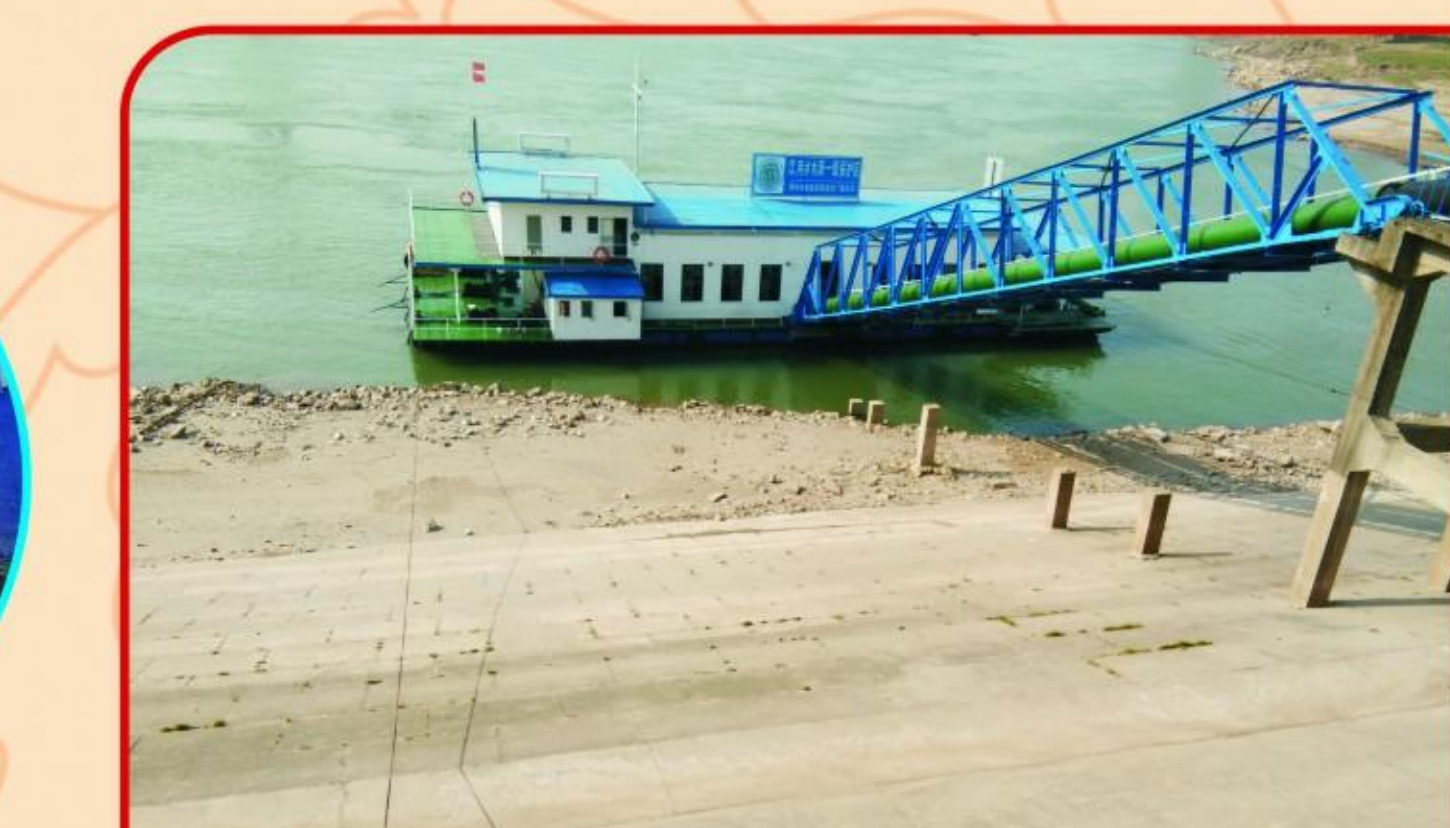
加强饮用水水源地保护