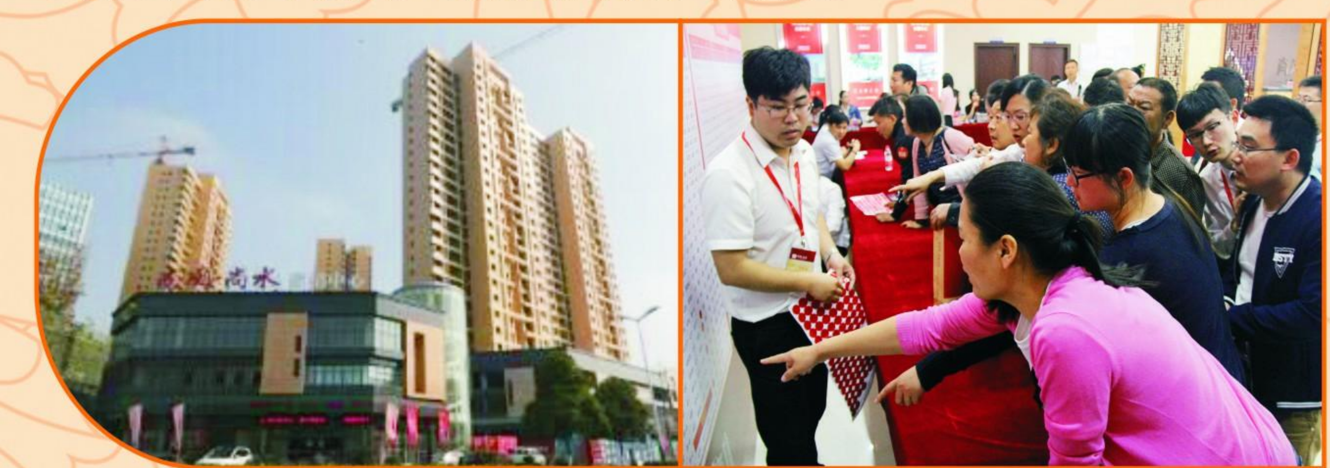
“尚风·尚水”楼盘火爆开盘

为确保公司可持续发展，进一步提高公司效益，公司积极拓展产业。“尚风·尚水”楼盘火爆开盘，销售态势喜人；浩宇给排水设计公司在对内日常设计工作任务重的情况下，在襄阳成立了分公司，自接和协作工程设计业务；鼎鑫源工程公司业务能力提升，市场拓展至河南、江西等省；水生木园林绿化公司全体干部员工勇闯市场，积极参加市内外景观绿化工程投标；水之道给排水维修服务公司、水质检测中心有限公司等在承接外部业务方面都取得了可喜成绩。