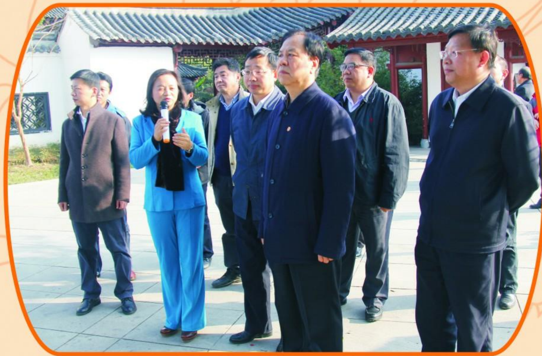
荆州市委书记李新华调研指导

企业的发展离不开各级领导的关心和支持。一年来，荆州市各级领导亲临集团公司视察调研，在肯定集团公司“安全供水，优质服务”的同时，就强化安全供水、加强饮用水源地保护等具体工作给出了明确的指导，极大地鼓舞了员工士气，强力助推荆州水务集团的发展。