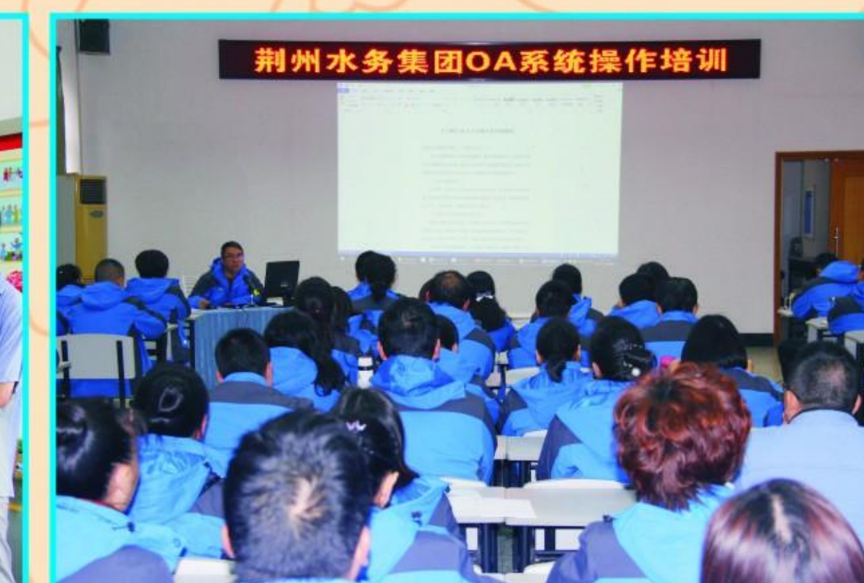
集团公司举办OA（办公自动化）系统操作培训