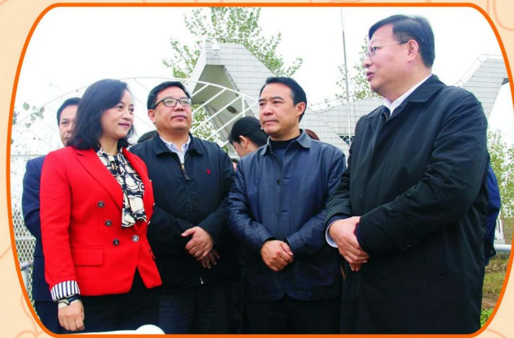
荆州市人民政府市长杨智调研指导