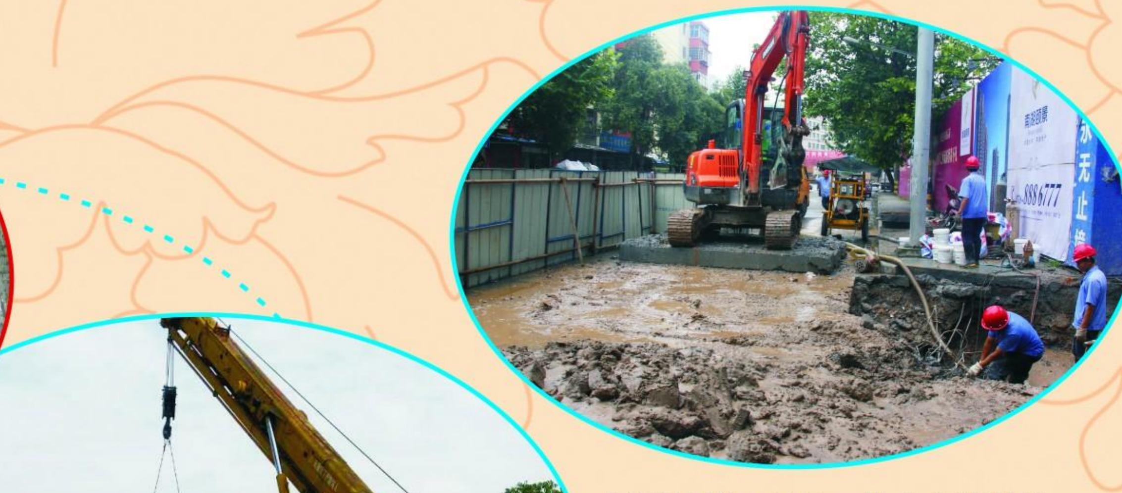
冒雨抢修DN1000mm供水主管现场