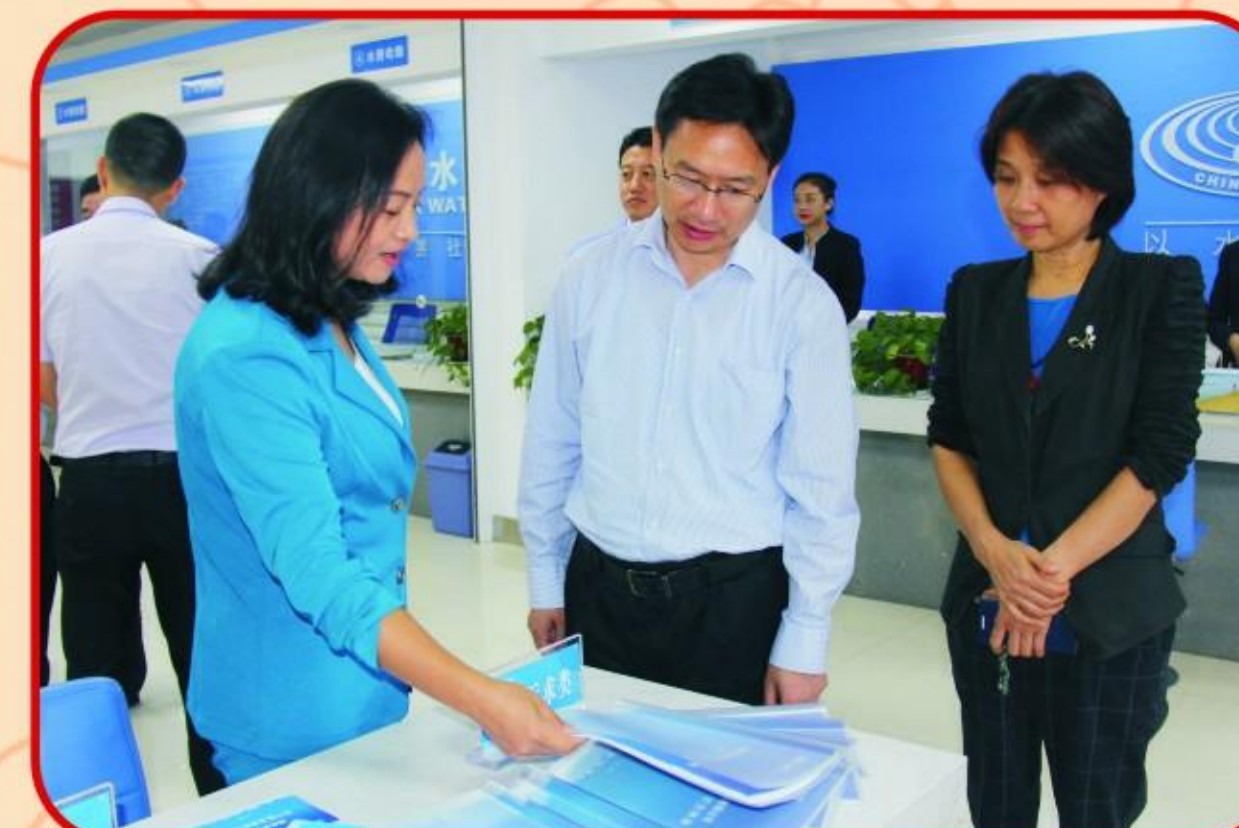
湖北省国资委领导检查指导工作