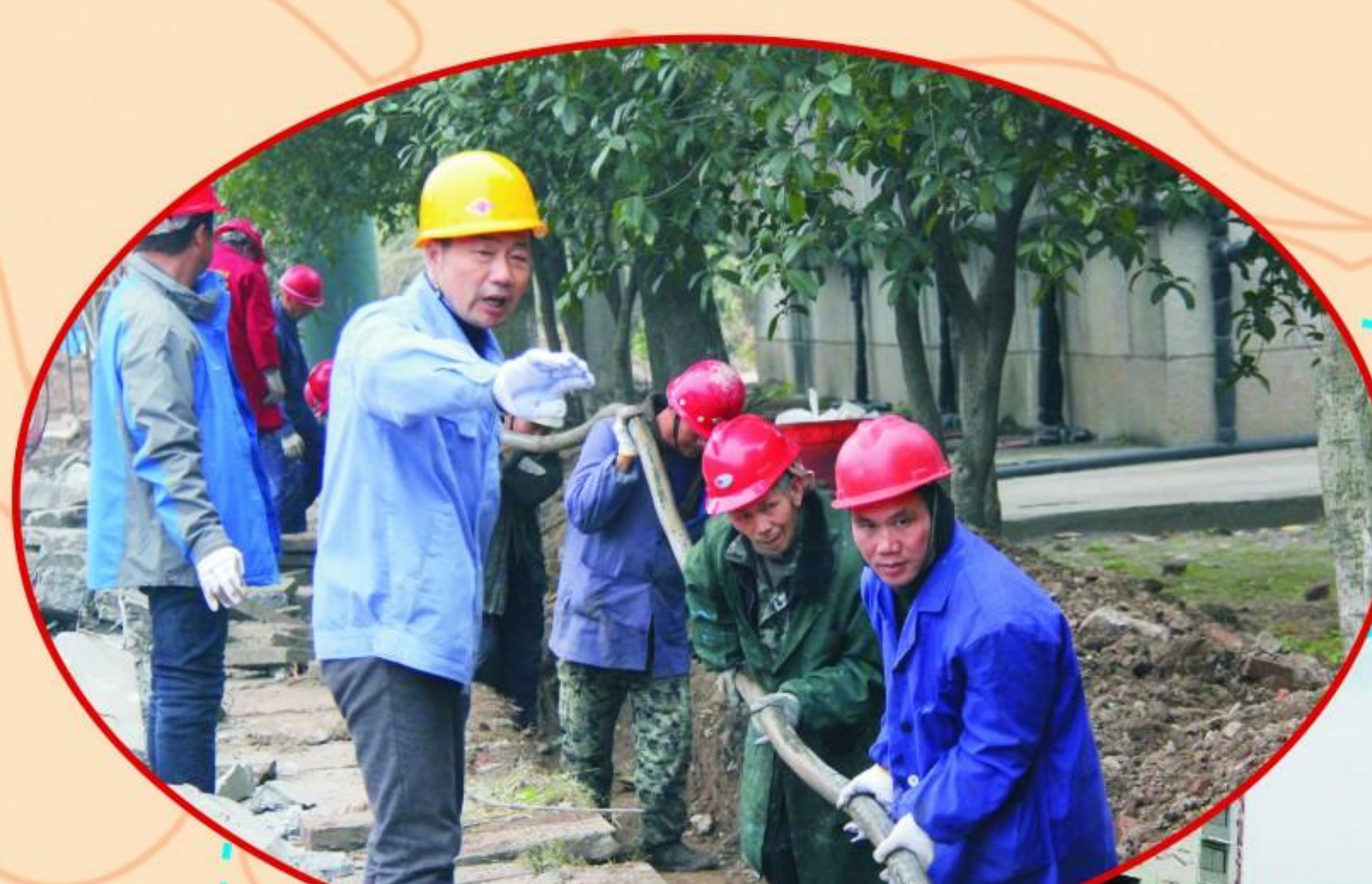
南湖水厂一期技改项目现场

同时，公司不断强化水质检测能力，确保水质安全；加大管网测漏巡检、管网附件管理力度；克服企业自身的经营压力，投入数千万元，进行城市管网建设及改造；加强饮用水水源地的保护工作，清理取水点周边可能污染源的个人及社会行为，并积极与上级各部门沟通，完成纪南生态文化旅游区备用水源地的申报及选址工作。