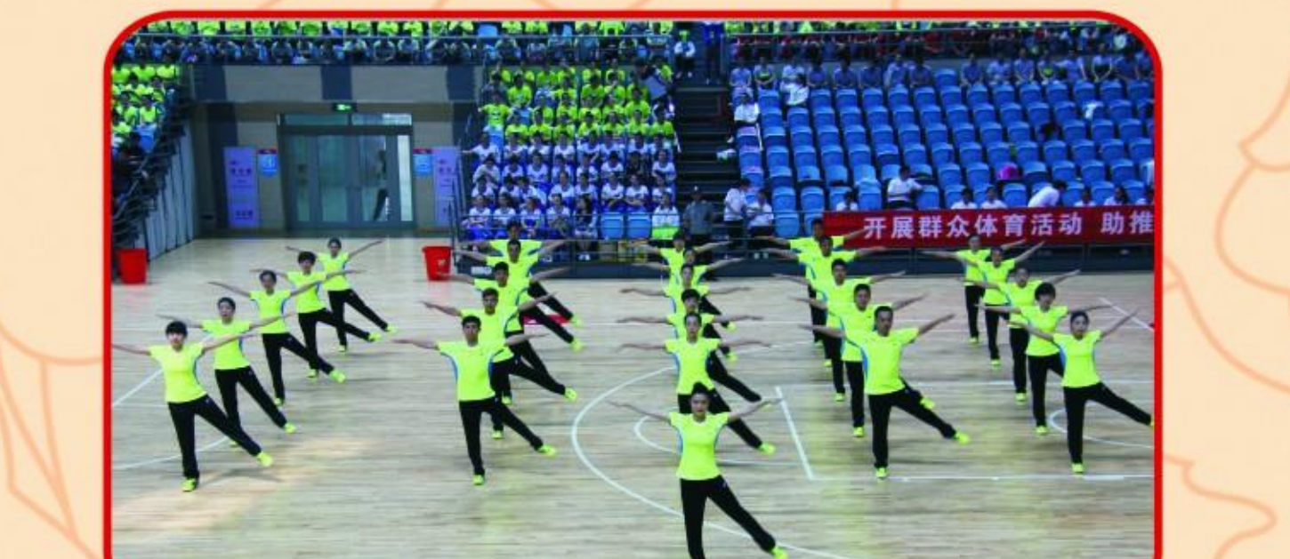
参加全市广播体操比赛