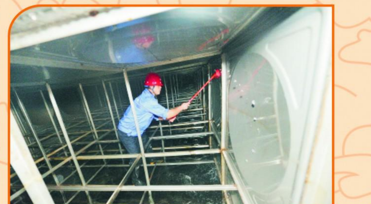
水池水箱清洗整治

2016年，集团公司配合城市创卫工作，不断延伸服务内容。为响应市委市政府创建国家卫生城市号召，公司抽调技术人员组建专班；在一个月内，完成40家主体单位的水池水箱清洗，30家酒店、学校、医院、商住楼、社区二次供水设施的安全检查和水池水箱清洗消毒，8处“三无”管理的二次供水泵房及设施全面升级改造；全力对老旧小区的水表箱进行整改更换，共更换表箱380处，受益水表1400余台；入冬后对冰冻隐患较为明显的水表义务穿上“保暖衣”；全年实施了景观观、月堤路、荆襄河南路等管网建设和洪坑小区等棚户区改造工程。