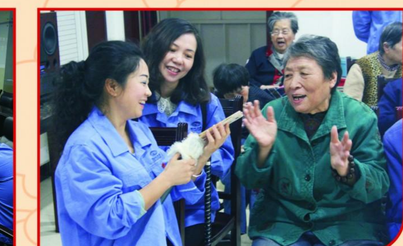
“上善若水映党徽”——走进养老院活动