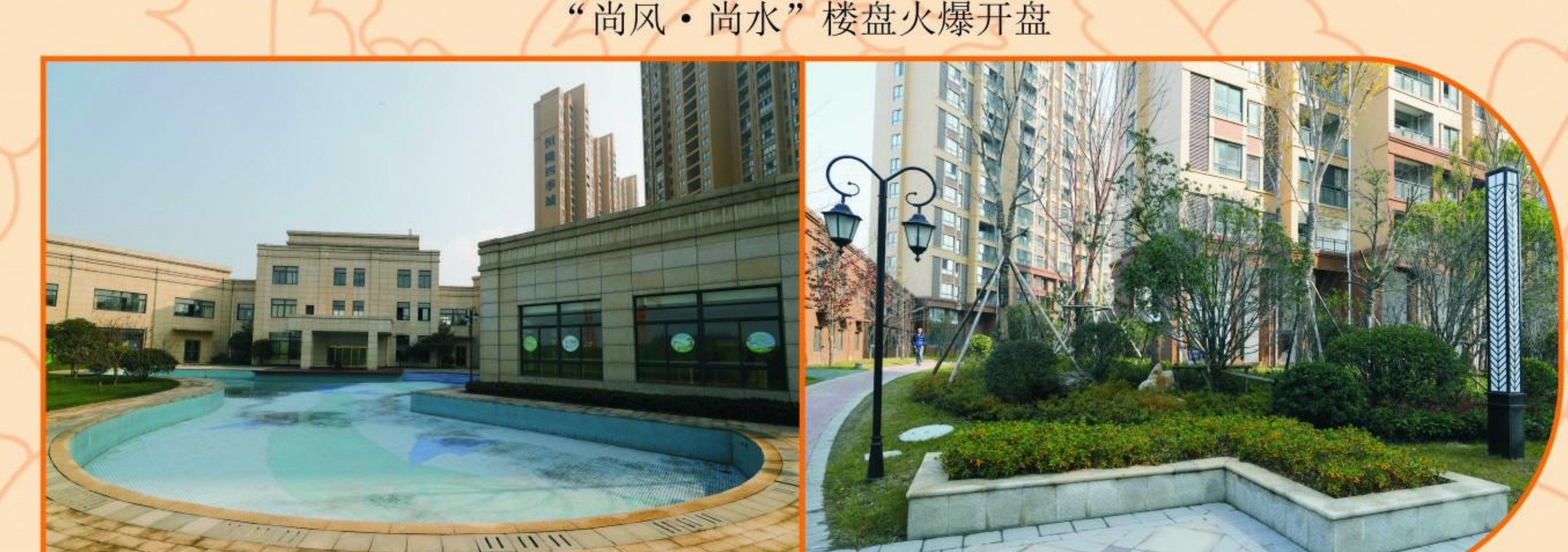
由水生木公司施工的园林绿化景观工程实景